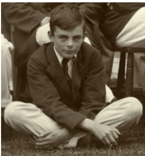
mladý Alan Turing

Obraz Turingova života také dokresluje vývoj vztahů Alanových nadřízených vůči němu. Nejdříve Turingovi bezmezně věří a samotný Churchill mu předává britské imperiální vyznamenání. Posléze se ale tajné složky čím dál víc starají, aby o Turingovi na veřejnost nepronikly žádné soukromé informace a aby se nikomu Turing nesvěřoval s přísně utajovanými materiály ze své práce. Alan tak policejnímu šéfovi kontruje na konci trefně replikou: "Tehdy jste mi věřili, tak proč ne dnes?"